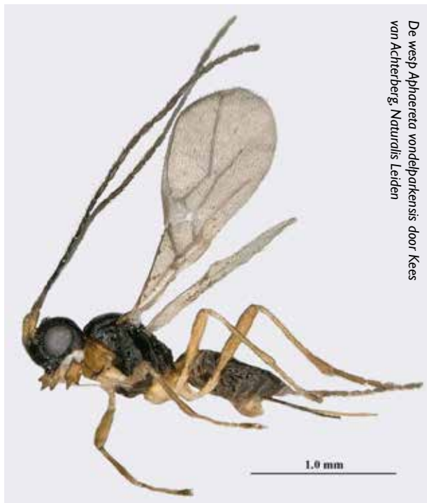
De wesp Aphaereta vondelparkensis